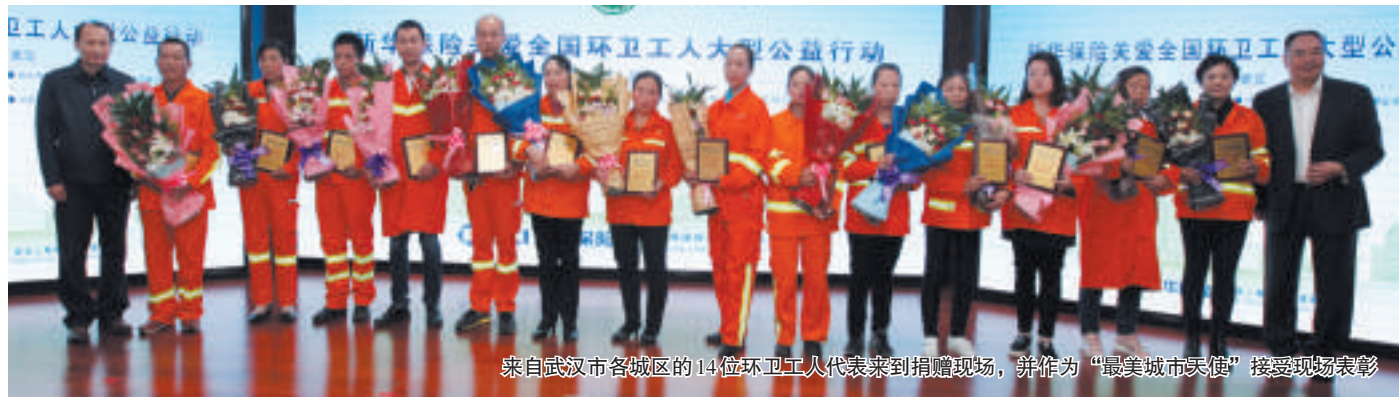
来自武汉市各城区的14位环卫工人代表来到捐赠现场，并作为“最美城市天使”接受现场表彰

新华保险监事长、新华人寿保险公益基金会理事长王成然在致辞中表示，关爱全国环卫工人大型公益行动是基金会成立后的首个项目、主打项目，也是将保险和公益相结合的特色项目，专为环卫工人量身定制。希望通过新华保险的绵薄之力，为“城市美容师”和“马路天使”构筑风险保障，并呼吁全社会一起来尊重和关爱环卫工人，共同为社会增添和谐安宁的力量。