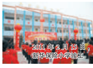
2011年2月15日，新华保险小学竣工