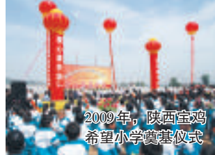
2009年，陕西宝鸡希望小学奠基仪式

2017年，承办新华保险“关爱全国环卫工人大型公益行动”西安站捐赠活动，向西安市31000名环卫工人每人捐赠10万元保额意外伤害保险，合计保额31亿元。